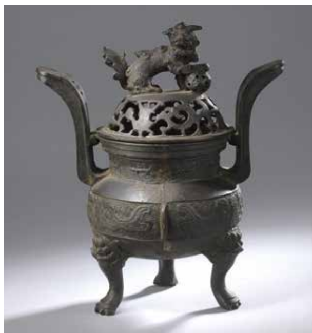
131 CHINE - XIXe siècle Brûle parfum de forme «ding» tripode en bronze à patine brune à décor archaïsant sur la panse de masques de taoïte, le couvercle ajouré surmonté d'un shi shi à la balle enrubannée. H. 30, 9 cm. 200/300€