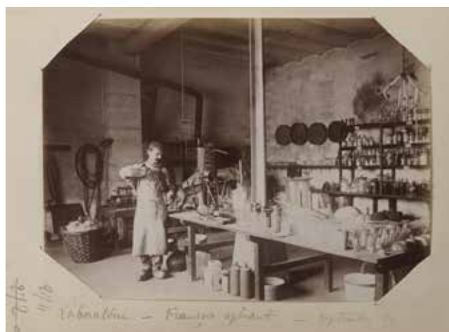
11/16 11/16 L'abbatiale - François Giffart - septembre 88