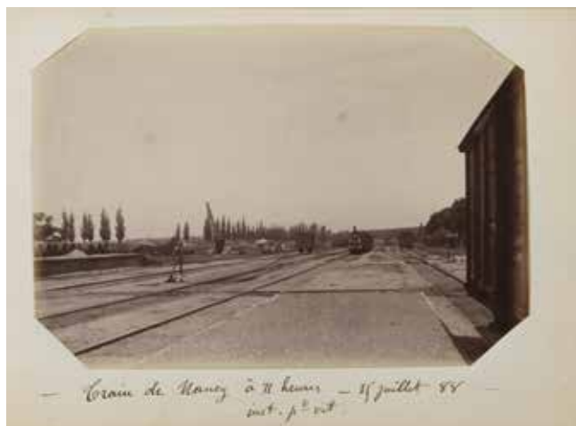
Corail de Nancy à 11 heures - 15 juillet 88 inst. p. 1. v. t.