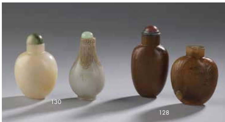
128 CHINE - XIXE/XXe siècle Deux flacons tabatière en agate caramel l'un sculpté en léger relief de tiges de fleurs. H. 6 et 5, 4 cm. L'un sans bouchon, l'autre bouchon rose en verre cerclé de métal. 200/300€