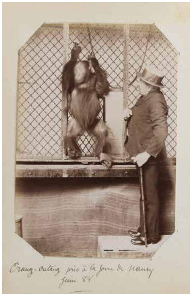
Orang-outang pris à la foire de Nancy juin 88