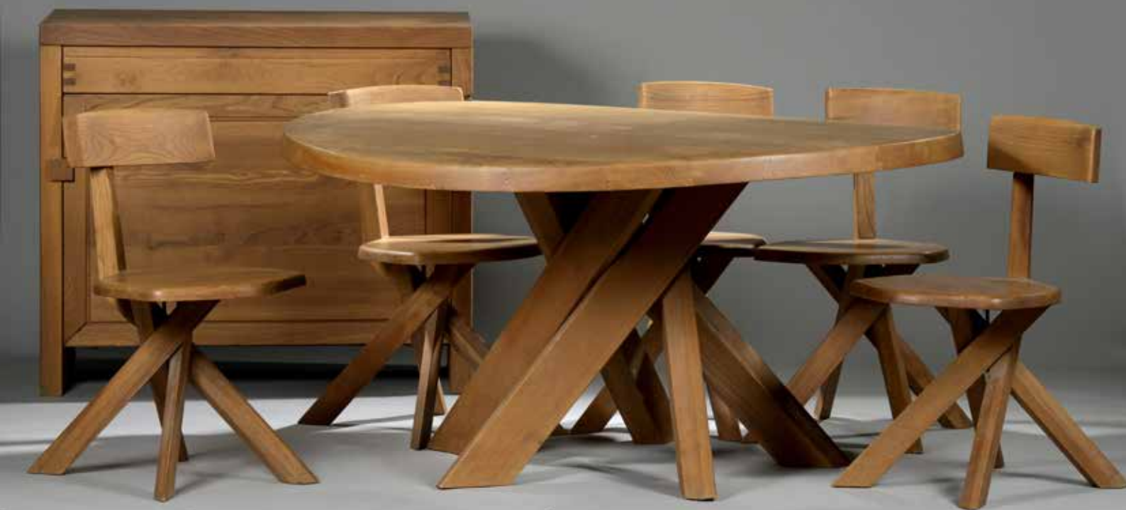
109 &amp; 109 BIS