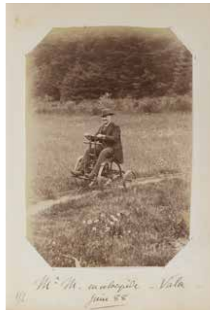
M. M. entomopide - Valla juin 88